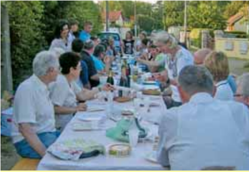
De nombreux voisins se sont retrouvés rue Salengro à l'occasion de l'apéritif de rue durant la soirée du vendredi 4 juin