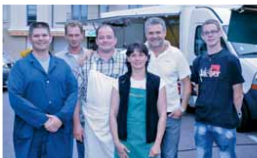
Le marché du jeudi matin a repris le 26 août avec les commerçants au complet.

Le 21 juillet dernier, le Maire s'entretenait avec les représentants des commerçants sur la mise en place prochaine de la zone bleue de stationnement, pour plus de rotation, plus de fluidité, rue Nationale de la rue de Villiers à la rue de Guernes, parkings compris et ainsi favoriser le commerce rosnéen.