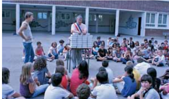
... et 33 aux élèves de la Justice passant en sixième au collège Sully