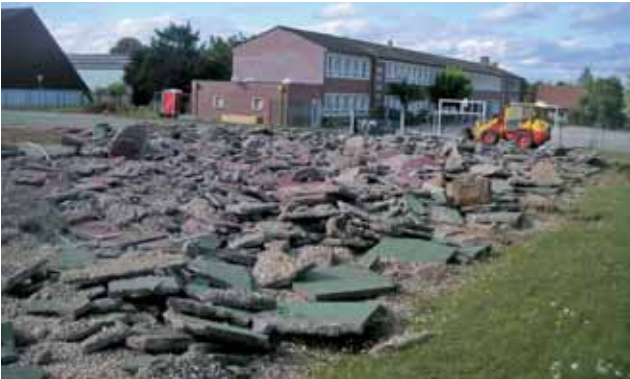
Acte I : la démolition des anciens courts de tennis a commencé le mois dernier

L' année scolaire rythme notre vie personnelle, professionnelle et associative. Septembre est notre vrai rendez-vous annuel de rentrée. Je vous souhaite donc une bonne rentrée, malgré un contexte économique et social tendu, lourd de menaces pour l'avenir.