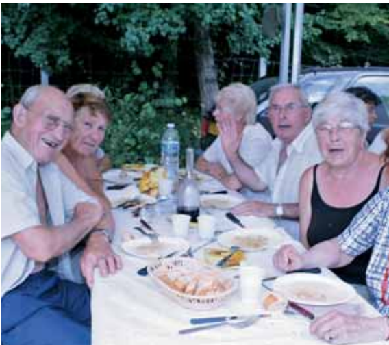
Promenade en forêt régionale, repas, animation l'après-midi ont été au programme des pique-niques du club Marguerite Guinet en juillet et en août à la Belle Côte

Tous les lots sont à retirer en mairie avant le 30 septembre 2010.