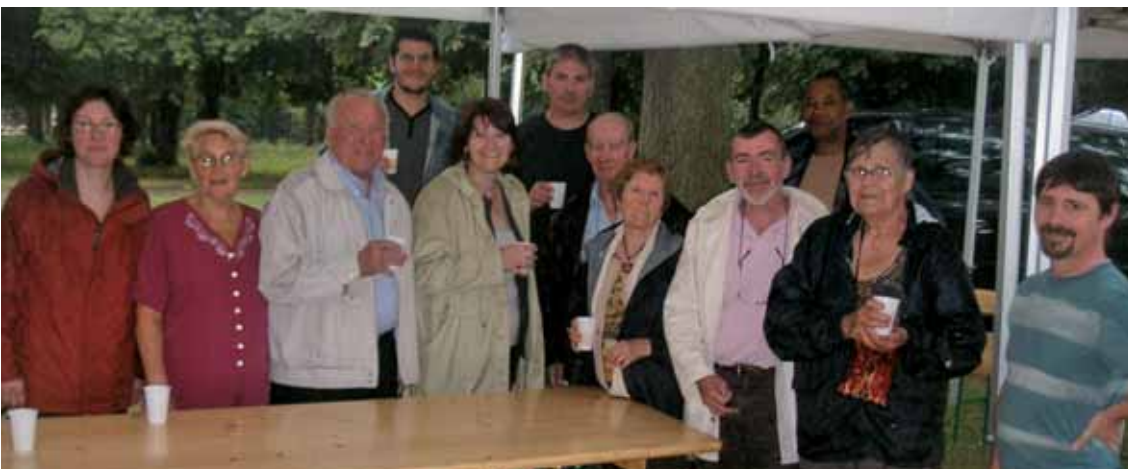
La pluie battante a obligé les organisateurs à renoncer au traditionnel pique-nique républicain du 14 juillet