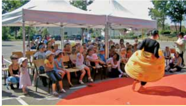
Spectacle de cirque pour le centre de loisirs maternel sur le parking Corot, mercredi 30 juin, dans le cadre du festival "Contentpourrien" avec la compagnie "Cirq'Envol"