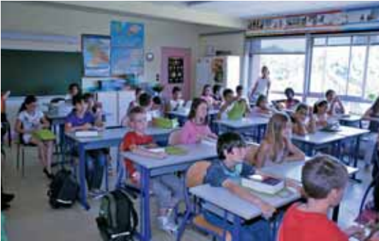
La Ville et la Caisse des écoles ont offert 35 dictionnaires aux élèves des Baronnes...